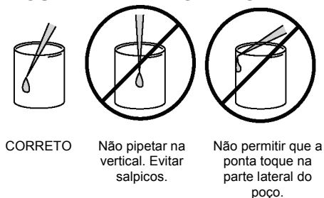
FIGURA 1: PIPETAGEM CORRETA