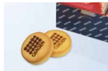
キアマンジュール