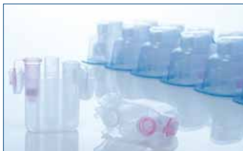
図 1. QIAGEN スピнкаラムと溶出カラムがセット済みのローターアダプター

動物細胞および標準的な組織、バクテリア、酵素反応液からのトータル RNA 精製用キット。スピнкаラムと溶出チューブセット済みローターアダプターを個別包装された状態でご提供します。