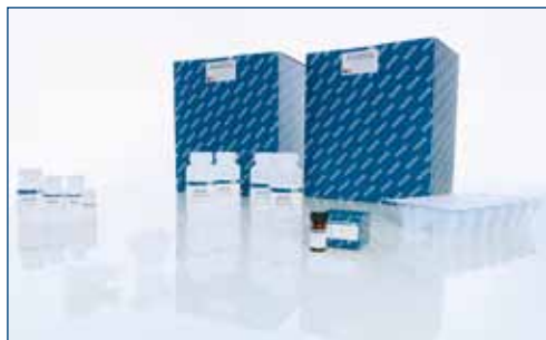
図 2. 必要な試薬とセット済みローターアダプターが入った QIAcube 専用キット

血液、組織および体液からのゲノム DNA およびウイルス DNA 精製用キット。本キットは、様々な臨床検体から高純度なゲノム DNA の自動化精製をさらに効率化できます。また、精製 DNA は各種アプリケーションに即使用可能です。