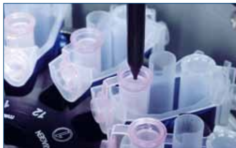
図 4. QIAcube に直接使用できるセット済みのローターアダプター

QIAcube 専用キットを用いることにより、ローターアダプターにスピんカラムと溶出チューブが設置済みのため (図 4)、従来のキット使用時に比べマニュアル操作時間が大幅に短縮されます。